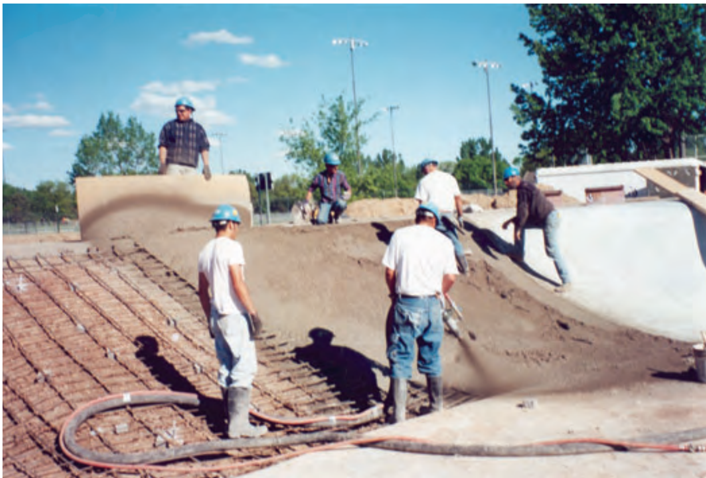
Торкретирование с использованием жёстких низкоосадочных смесей - это обычная повседневная работа для Маусо С30HD.

Все спецификации и комплектации могут быть изменены без уведомления.