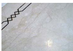
Пятна на мраморе после обработки