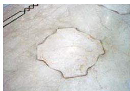
Пятна на мраморе до обработки